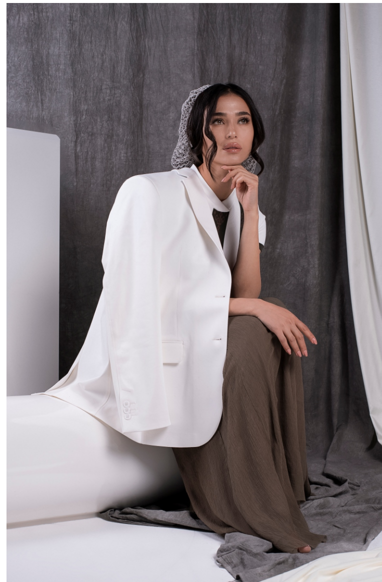
Пиджак S19FKW1903 Платье DS19FKW1903