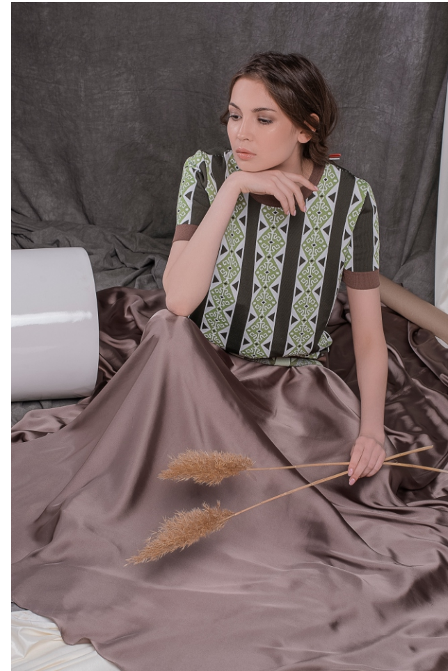
Туника S19FKW1005 Юбка S19FKW1904