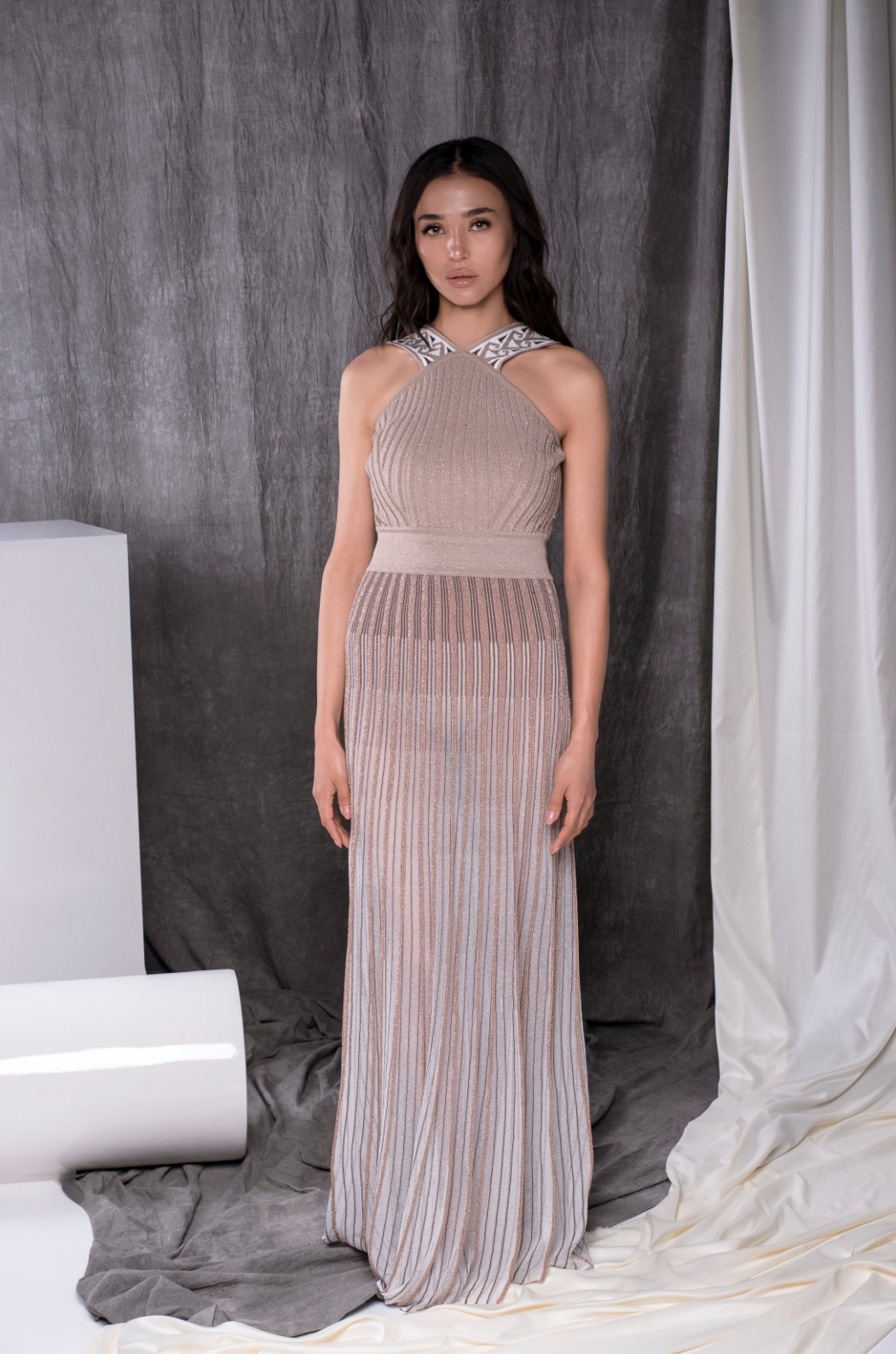
Платъе S19FKW1009 Накидка S19FSW1905