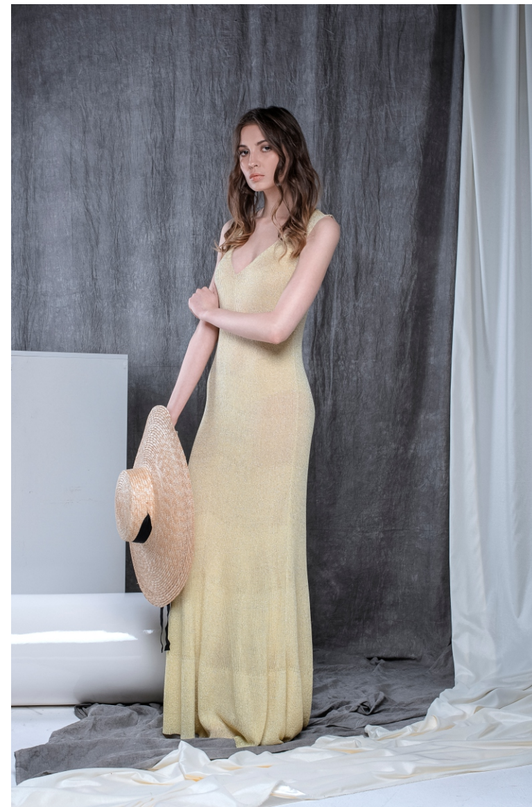
Платье S19FKW1007 Аксессуар для волос S19FKW2001