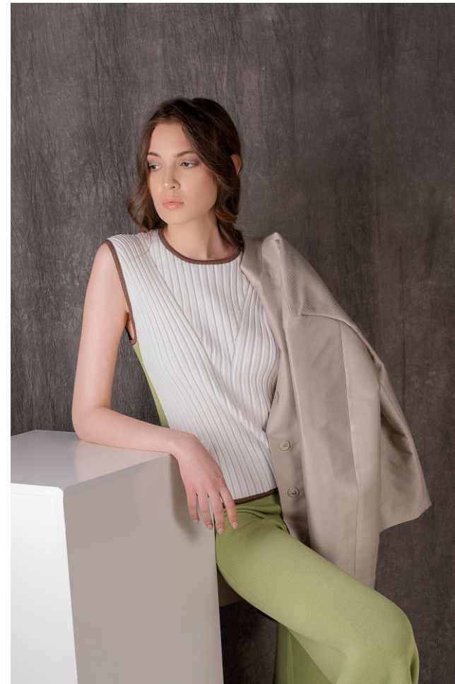
Топ S19FKW0405 Кюлоты S19FKW0703 Жакет DS19FSW1901