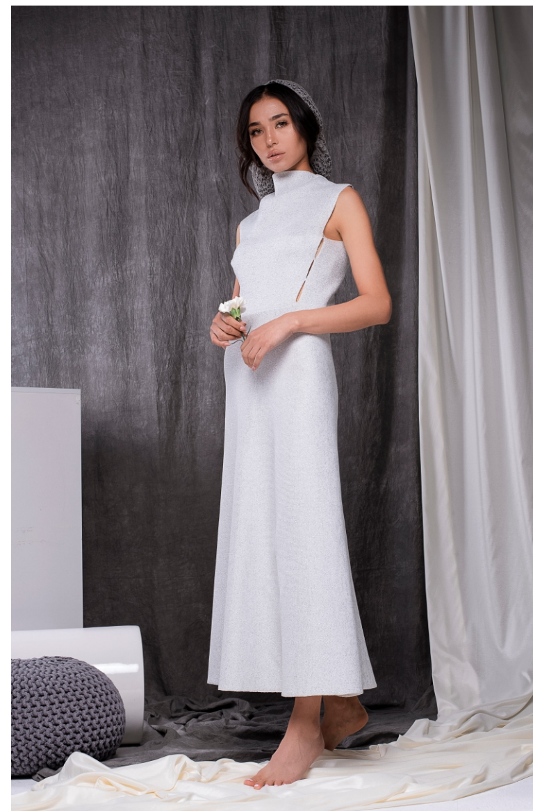
Платье S19FKW1006 Пиджак-балеро S19FKW1902