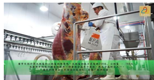
屠宰车间计算大牲畜和小牲畜的屠宰线。大牲畜的能力是每班250头,小牲畜 - 700头。 “Kublei”是哈萨克斯坦最大的清真肉类加工企业,也是全球领先的清真肉类加工企业。 “Kublei”是哈萨克斯坦最大的清真肉类加工企业,也是全球领先的清真肉类加工企业。